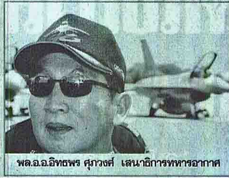
พล.อ.อ.อิทธิพร ศุภวงค์ เสนาธิการทหารอากาศ

อ เครื่องบินขับไล่แบบ 19/ก หรือ “เอฟ-16” ถือเป็นเครื่องบินที่มีความทันสมัย และทรงสมรรถนะสูงสุดของกองทัพ อากาศไทยมาเป็นระยะเวลาช้านาน เมื่อวันที่ 28 พฤษภาคม 2551 ซึ่งถือเป็นวันครบรอบ 20 ปีของการนำเครื่องบินรุ่นนี้เข้าประจำการ กองทัพอากาศได้จัดงานแสดงการบินโชว์ศักยภาพของเครื่องบินเอฟ-16 ขึ้นอย่างยิ่งใหญ่ ที่กองบิน 1 จ.นครราชสีมา พล.อ.อ.อิทธิพร ศุภวงค์ เสนาธิการทหารอากาศ และผู้บังคับฝูงบิน 103 (เอฟ-16 เอ/บี) คนแรกของกองทัพอากาศไทย ราลึกอดีตว่า ฝูงบิน 103 เป็นฝูงบินแรกที่จัดหาเครื่องบินรุ่นเอฟ-16 เข้าประจำการ ในปี 2531 จากนั้นอีก 7 ปีก็มีการจัดหาเครื่องบินเพิ่มเติมอีก 18 เครื่อง และในปี 2545 ก็จัดหาอีก 12 เครื่อง เพื่อทดแทนเครื่องบินเก่าที่ปลดประจำการ ตั้งแต่เครื่องบินเอฟ-16 เข้าประจำการในกองทัพอากาศ ประเทศไทยยังไม่มีปัญหาความขัดแย้งถึงขั้นใช้กำลังทางอากาศเข้าปะทะหรือสกัดกัน เนื่องจากการมีเครื่องบินที่ทันสมัยจะเป็น “หลักประกัน” ในการป้องกันภัยคุกคามได้เป็นอย่างดี ในรอบ 20 ปี ที่ผ่านมามี กองทัพอากาศมีการฝึกนักบินเอฟ-16 มาทำการทดแทนมากกว่า 100 คนแล้ว ปัจจุบันเครื่องบินเอฟ-16 ที่เข้าประจำการในกองทัพอากาศมีจำนวน 3 ฝูง และสามารถปฏิบัติภารกิจได้หลายภารกิจ เช่น ภารกิจโจมตีภาคพื้น และการติดอาวุธต่อสู้แบบอากาศต่ออากาศ เป็นต้น