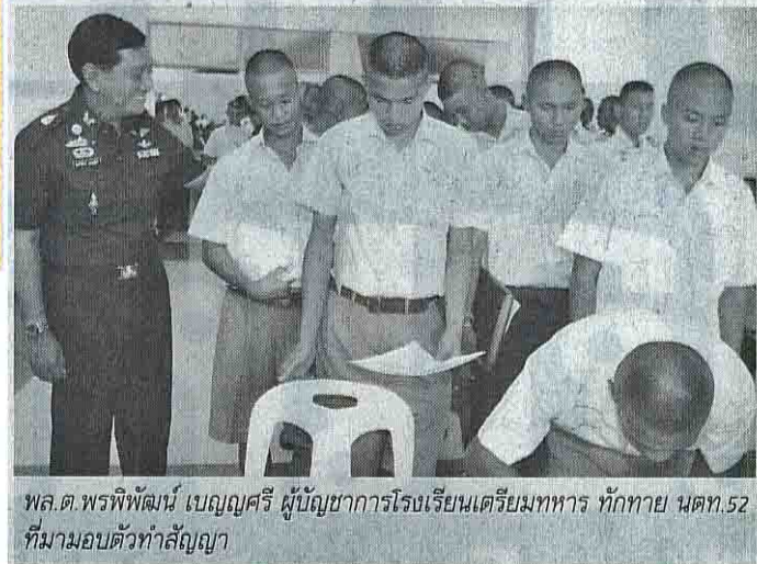
พล.ต.พรพิพัฒน์ เบญญศรี ผู้บัญชาการโรงเรียนเตรียมทหาร ทักทาย นตท.52 ที่มาขอตัวทำสัญญา

ยังคงไม่เปลี่ยนแปลง ความรุนแรงไม่มีผลต่อการตัดสินใจ