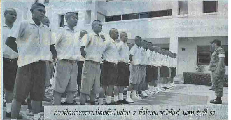
การฝึกทาทหารเบื้องต้นในช่วง 2 ชั่วโมงแรกให้แก่ นตท.รุ่นที่ 52

ภาระหน้าที่ที่พวกเขาจะต้องไปเผชิญในอนาคตมีแต่ความลำบากและอันตราย นั่นคือ ที่มาของจำนวนผู้ที่สมัครเป็นนักเรียนเตรียมทหารจึง