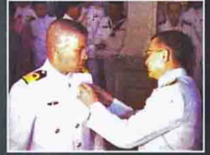
รางวัลประทีป อโนมณี