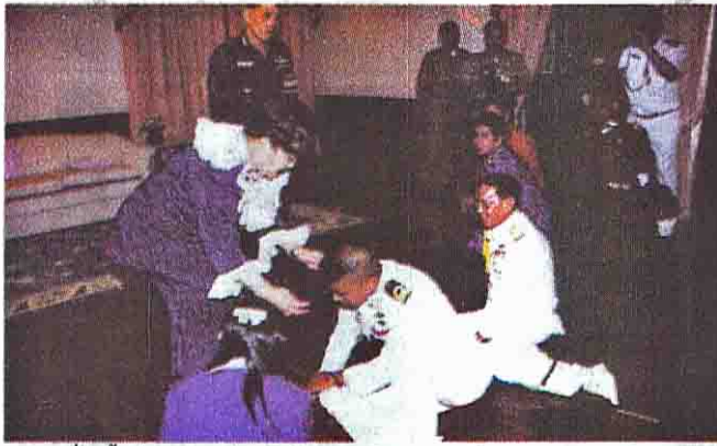
เมื่อครั้งเรือเอกประทีปเข้าเฝ้าฯ สมเด็จพระนางเจ้าฯ พระบรมราชินีนาถ

หัวข้อข่าว: ประทีป อนุภุมณี วีรบุรุษแห่งดุจขงญอ