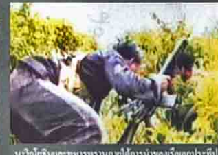
นำวีรกรรมและทหารพรานกบฏใต้การนำของเรือเอกประทีป อโนมณีที่ถ้ำระ อีสาน