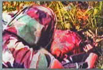
นำวีรกรรมของวีรบุรุษประทีป อโนมณีที่ถ้ำระ อีสาน